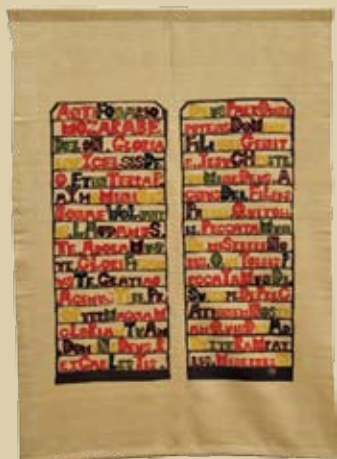
型絵染飾布《モサラベ》個人蔵