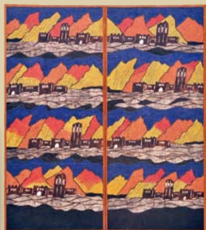
型絵染四曲屏風《キャラバンの宿(キャラバンサライ)》個人蔵