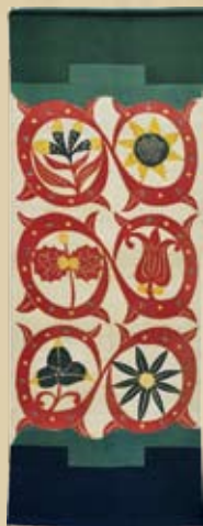
型絵染飾布 個人蔵