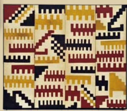
型絵染四曲屏風《ナスカの印象》個人蔵