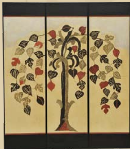
型絵染三曲屏風《絹の道の枝垂桑》個人蔵